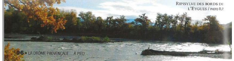
RIPISYLVE DES BORDS DE L'EYGUES

comme les saules, le myricaire d'Allemagne et le castor d'Europe. Celui-ci laisse derrière lui de nombreuses traces bien visibles, troncs coupés et branchages dans l'eau. Le martin-pêcheur est également un hôte régulier ainsi que le chevalier guignette, petit échassier de la famille des oiseaux limicoles, c'est-à-dire littéralement « oiseaux de rivages ».