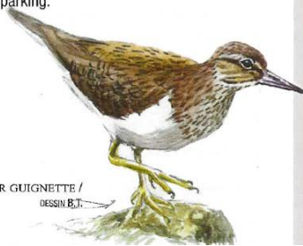
CHEVALIER GUIGNETTE / DESSIN B.T.